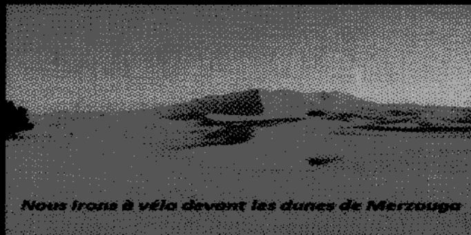
Nous irons à vélo devant les dunes de Merzouga